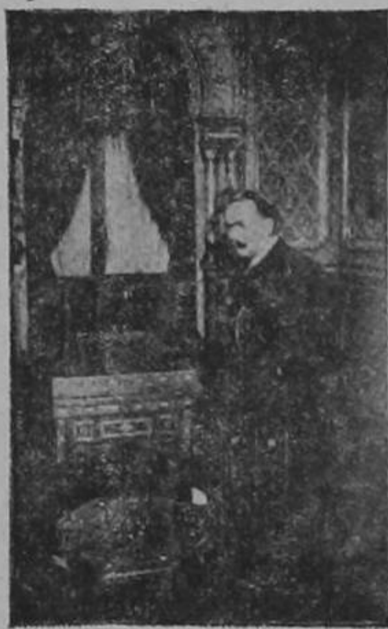
El General Obregón ha sido asesinado

¿Quiénes son los mayores enemigos que tienen los niños costarricenses?